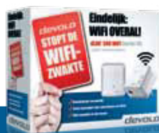
dLAN® 500 WiFi Starter Kit