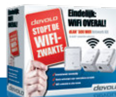
dLAN® 500 WiFi Network Kit