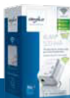
dLAN® 500 WiFi